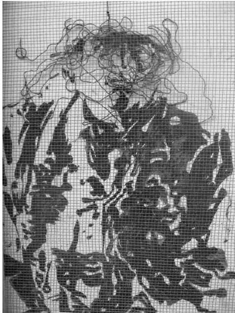
Catatumbo –Detalle-. Luis Brahim. Técnica mixta. 2002.