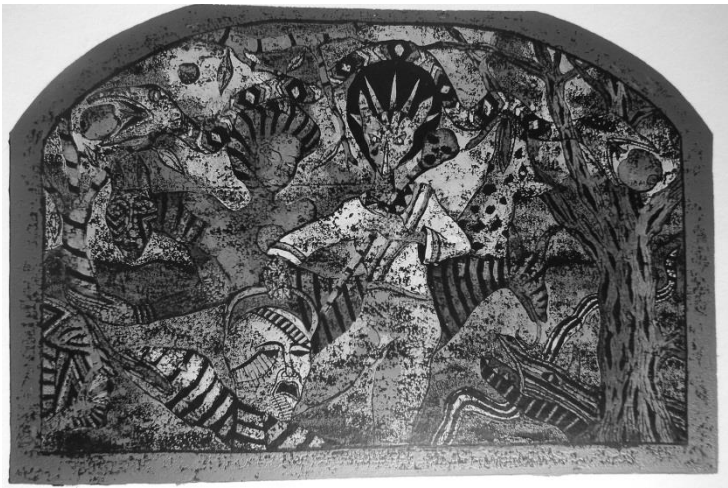
Critos Ausentes II. César Herrera. Grabado linóleo- 2000.