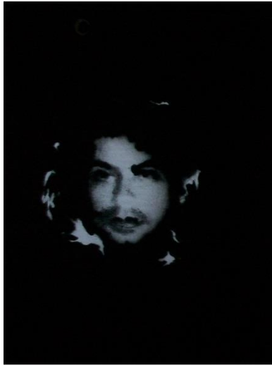
Serie, Los que no duelen. Hernando Cruz. Técnica Mixta. 2011.