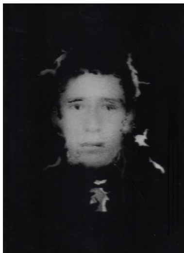
Serie, Los que no duelen. Hernando Cruz. Técnica Mixta. 2011.