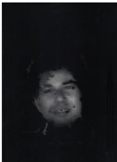
Serie, Los que no duelen. Hernando Cruz. Técnica Mixta. 2011.