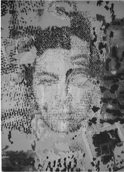
Rostro que no se encuentra. Hernando Cruz. Collage. 2004.